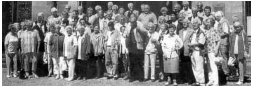
Die Teilnehmer des Verbandes Duisburger Bürgervereine vor dem Frankfurter Römer

Verband der Bürgervereine mit 80 Aktiven nach Frankfurt gereist